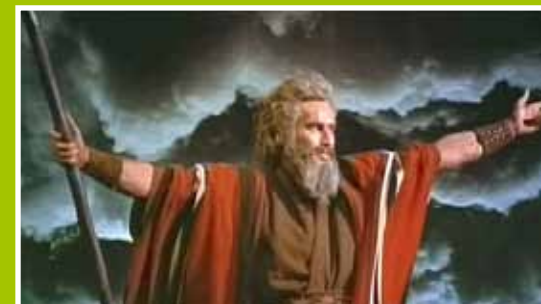
Charlton Heston som en noget arisk udseende Moses i "De 10 bud"

Jesus er overgangen for os fra et liv i fangenskab af skyld, død og meningsløshed – og til det lovede land med Gud. For ved troen på Jesus er vi allerede "gået over fra døden til livet" og har fået "liv i overflod".