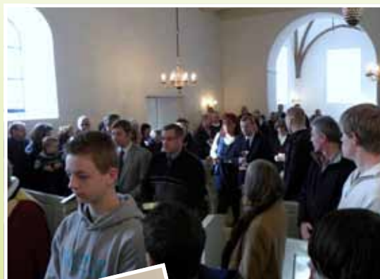
Menigheden ved åbningen

Disse genstande blev atter placeret de rigtige steder i kirkerummet, og efter en lykønskningstale til menigheden og ordene om at "Vi er hans får, den flok Han vogter" og de bedste ønsker for kirkens