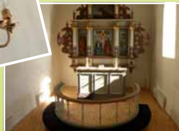
Det renoverede alter med helt ny alterskranke med egetræs håndliste!

brug for alle sognebørn, kunne biskoppen erklære Kgs. Tisted Kirke for åbnet for menighedens brug på ny.