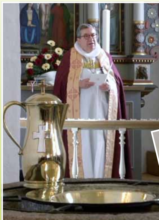
Biskoppen ved indvielsen