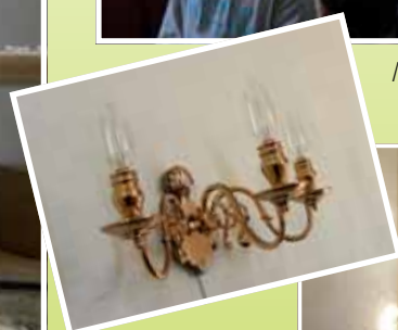
De nye smukke lampetter