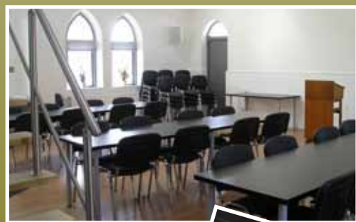
Efter. Sognehuset i august.