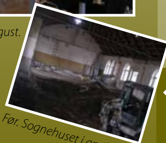
Før. Sognehuset i april