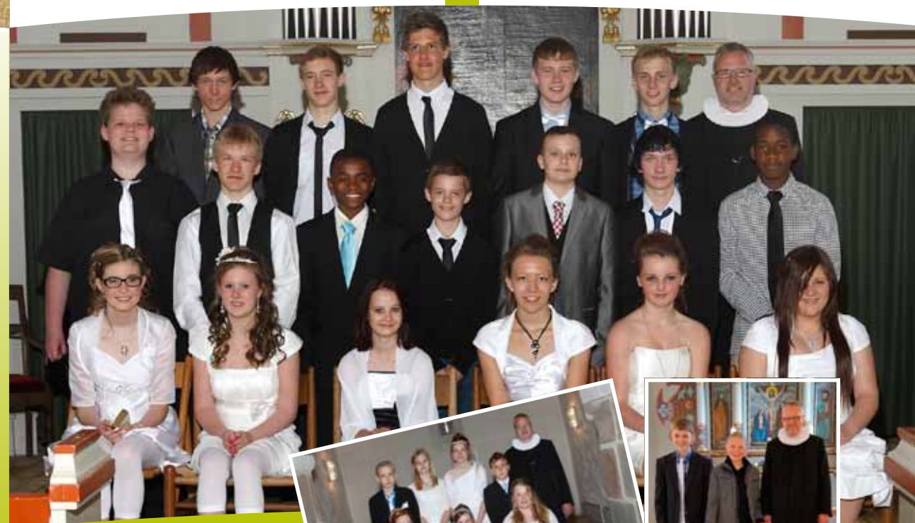
Durup 24. april 2011 Binderup 1. maj 2011 Kgs. Tisted 20. maj 2011