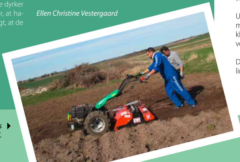
Markjorden fræses og bliver til havejord. ▶