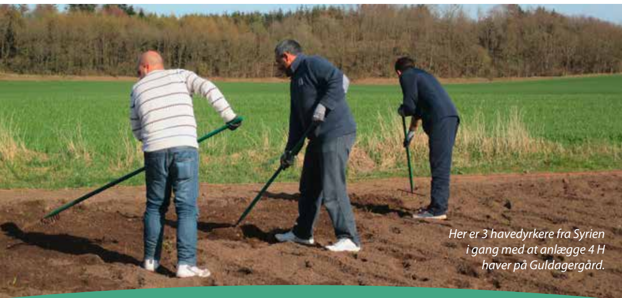
Her er 3 have dyrkere fra Syrien i gang med at anlægge 4 H haver på Guldagergård.