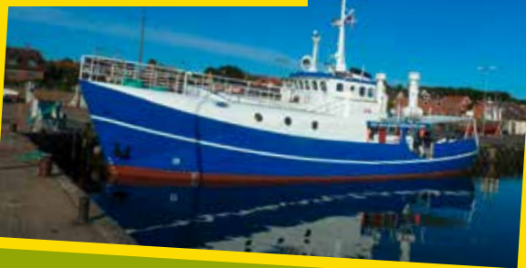
Sømandsmissionens sejlede sømandshjem "Bethel"

www.somandsmissionen.dk/danmark/bethel/sejlsplan-2015/